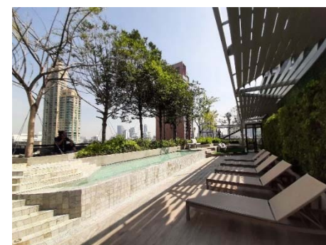
ภาพที่ 1.3-1 สภาพปัจจุบันของโครงการ